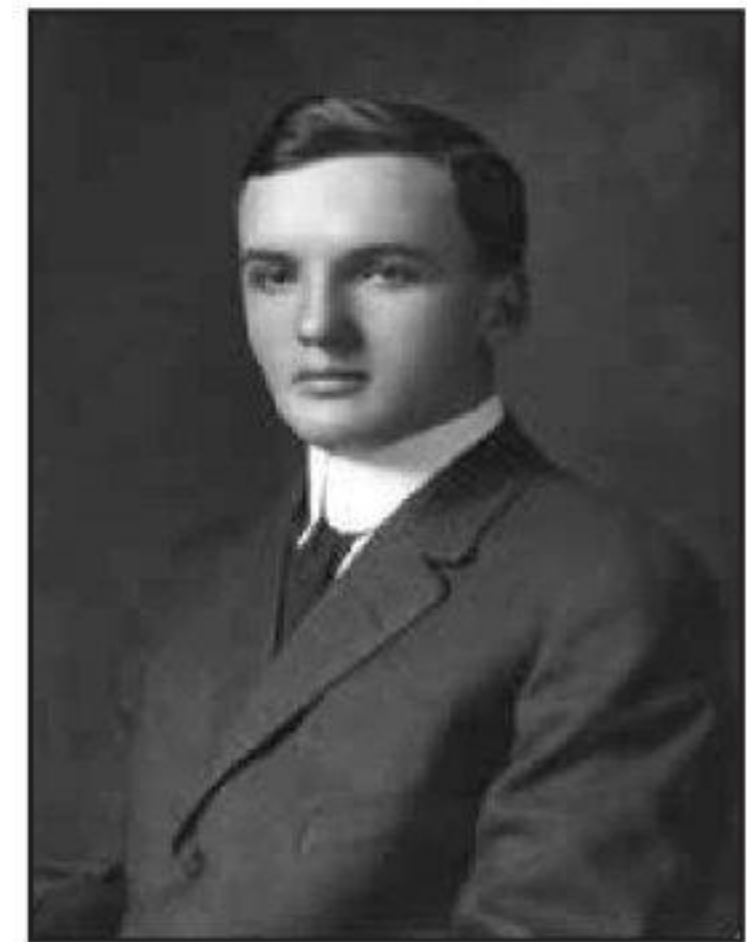
B (ලකුණු 04 යි)